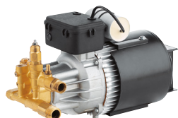
Mod. 1508 (HRM)