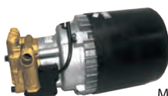
Mod. 150 TSS