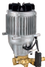
Mod. 160 TSS